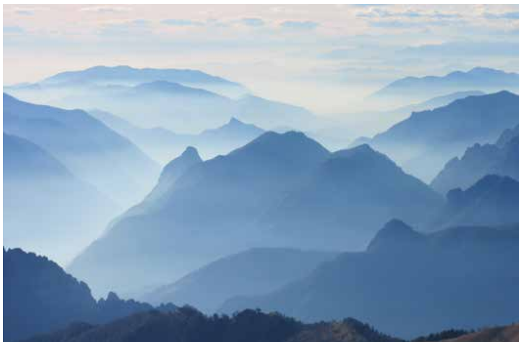
▽ foto 8ª classificata Piero Valtorta "Vista da Sant'Amate (Bregagno)"