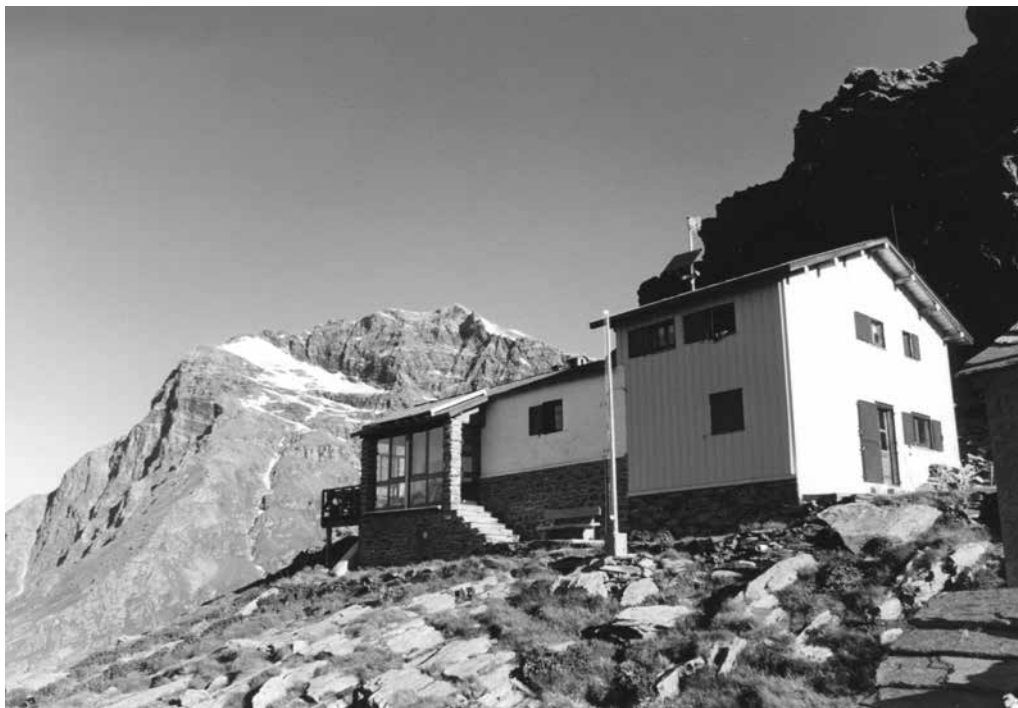
△ Rifugio "Longoni" mt. 2450 CAI SEREGNO