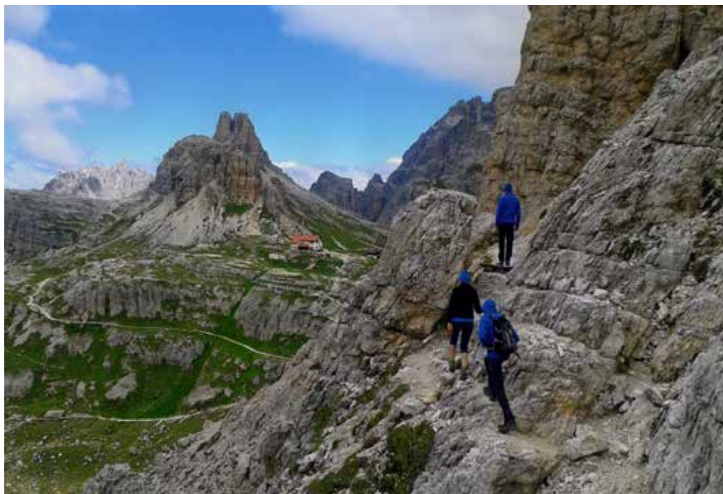
foto 6ª classificata △ Paolo Colzani "...Dipinti di blu, felici di stare lassù..."