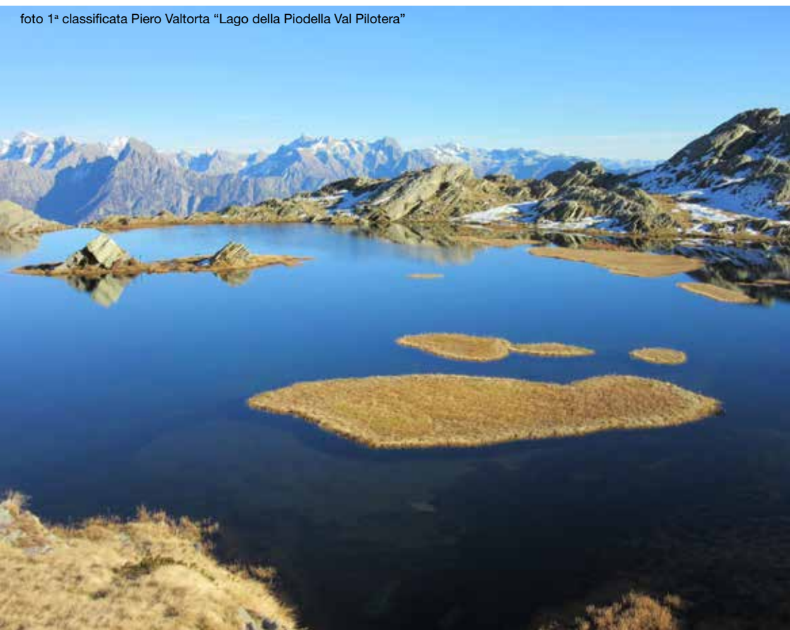
foto 1ª classificata Piero Valtorta "Lago della Piodella Val Pilotera"