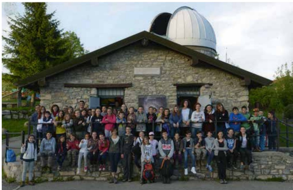
Club Alpino Italiano Sez. MARIANO COMENSE