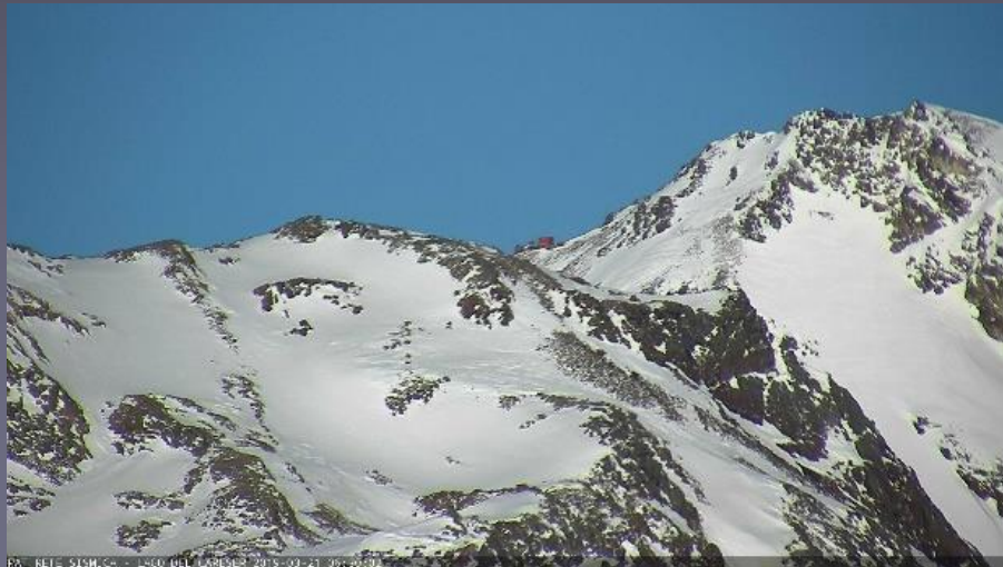
Il bivacco Colombo inquadrato della webcam della diga del lago del Careser

6 settembre 2019 Bivacco Colombo 60 anni di fondazione